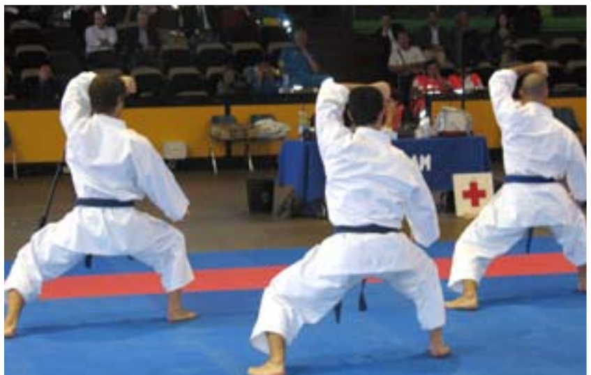
In azione la squadra dell'ASD Master Milano, seconda classificata