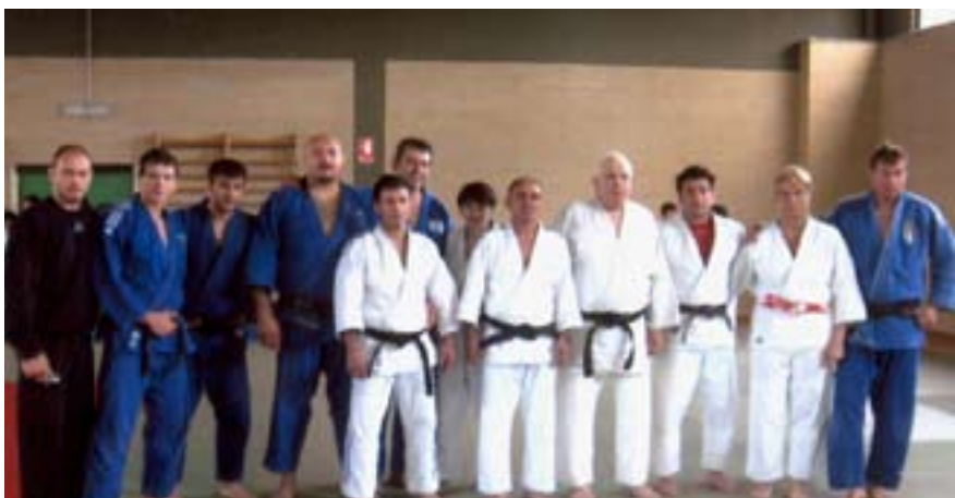
Insieme per una nobile causa