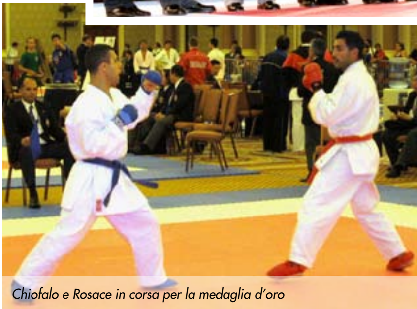
Chiofalo e Rosace in corsa per la medaglia d'oro