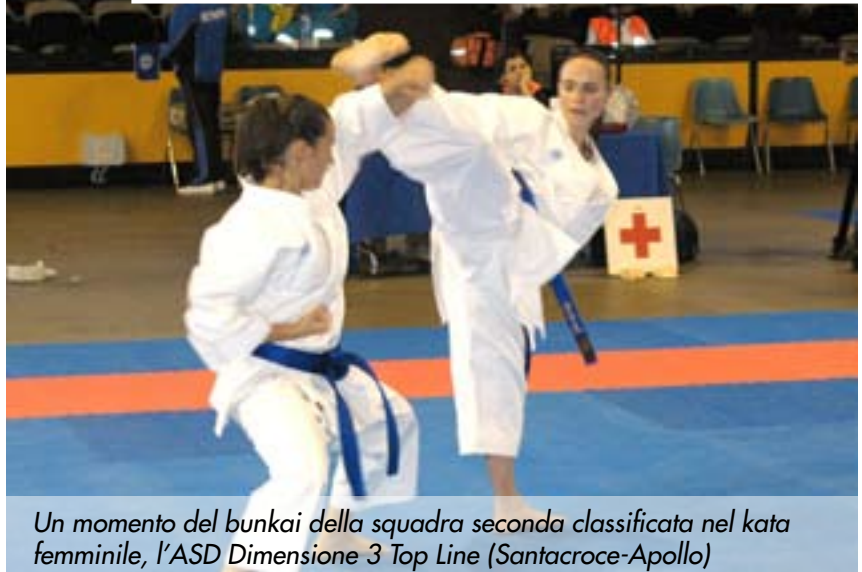
Un momento del bunkai della squadra seconda classificata nel kata femminile, l'ASD Dimensione 3 Top Line (Santacroce-Apollo)