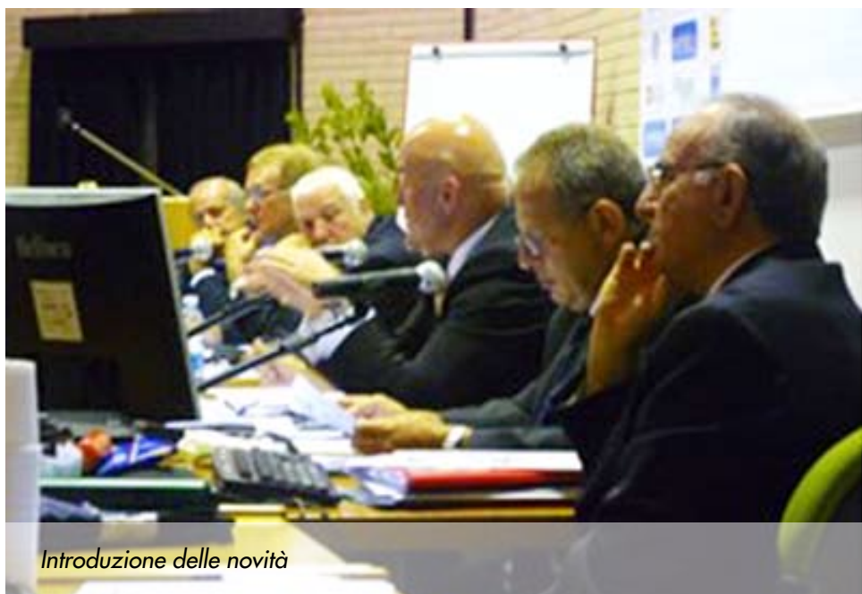
Introduzione delle novità