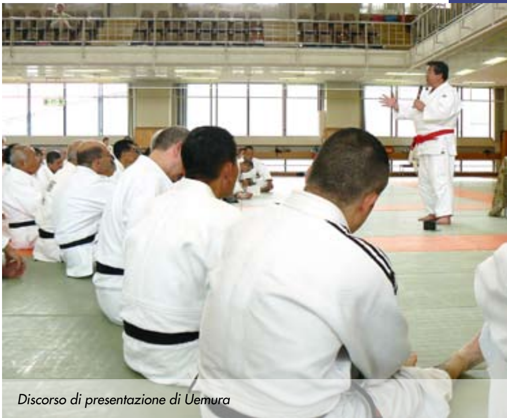
Discorso di presentazione di Uemura

Al rientro in patria per i molti connazionali partecipanti al kosshukai, il senti-