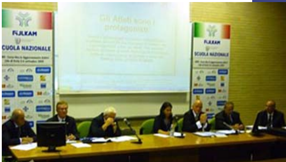
Il tavolo dei relatori

Sono stati illustrati i nuovi indirizzi introdotti dalla commissione EJU/IJF in merito alle interpretazioni ed i test che andranno ad essere fatti entro