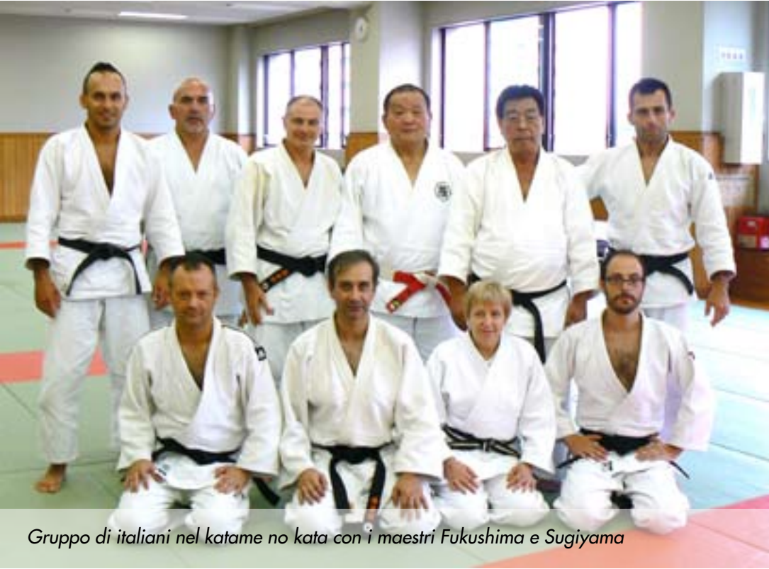
Gruppo di italiani nel katame no kata con i maestri Fukushima e Sugiyama